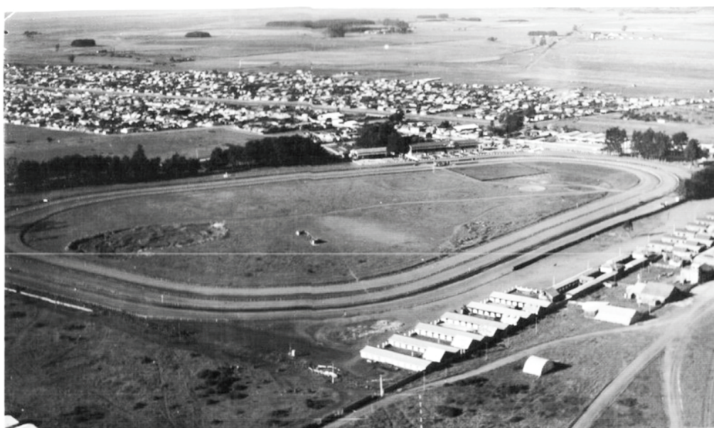
FIGURA 2 | Alrededores Club Hípico, 1962. Hualpén